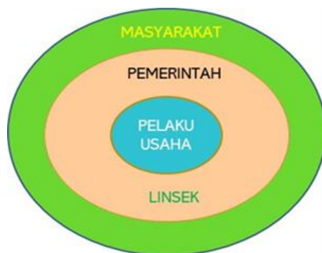
Gambar 2.3 Tiga Pilar Pengawasan Obat dan Makanan

Pengawasan obat dan makanan bersifat unik karena tersentralisasi, yaitu dengan kebijakan yang ditetapkan oleh Pusat dan diselenggarakan oleh Balai dan Loka di seluruh Indonesia. Hal ini tentunya menjadi tantangan tersendiri dalam pelaksanaan tugas pengawasan, karena kebijakan yang diambil harus bersinergi dengan kebijakan dari Pemerintah Daerah, sehingga pengawasan dapat berjalan dengan efektif dan efisien. Pada Gambar 2.3 dapat dilihat hubungan antara pemerintah, pelaku usaha, dan masyarakat dalam pengawasan obat dan makanan.