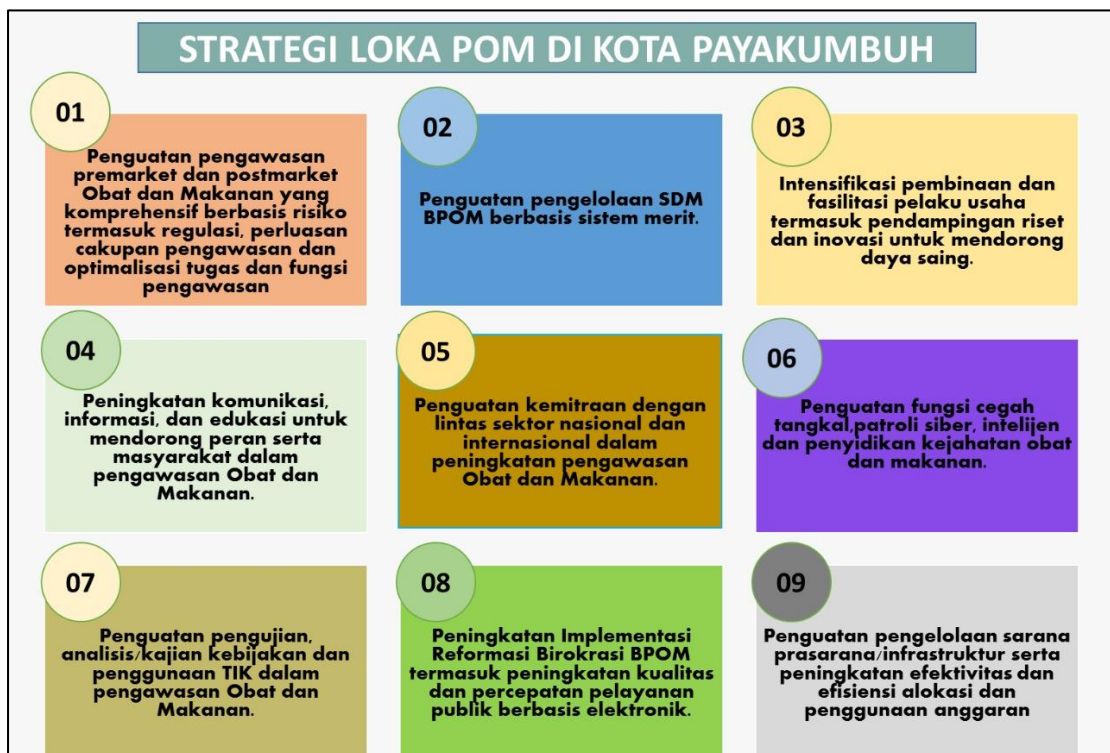
Gambar 3.1 Strategi Loka POM di Kota Payakumbuh

Untuk dapat melaksanakan kebijakan tersebut, Loka POM di Kota Payakumbuh melakukan analisis program strategis dengan memperhitungkan hasil analisis SWOT, sehingga diperoleh rumusan strategi sebagai berikut: