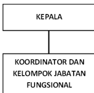
Gambar 1.1 Struktur Organisasi Loka POM di Kota Payakumbuh

Struktur Loka POM di Kota Payakumbuh dibuat berdasarkan Peraturan Badan Pengawas Obat dan Makanan Nomor 22 tahun 2020 tentang Organisasi dan Tata Kerja Unit Pelaksana Teknis di Lingkungan Badan Pengawas Obat dan Makanan sebagai berikut: