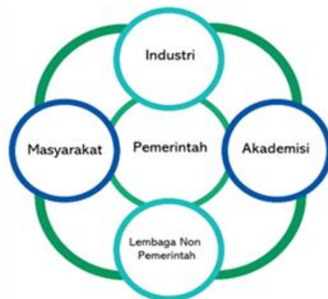
Gambar 2.4 Penta Helix Pengawasan Obat dan Makanan

Namun demikian, pengawasan obat dan makanan sejatinya masih memerlukan adanya sinergitas dengan pemangku kepentingan lain di antaranya akademisi dan media, mengingat perannya sangat penting di dalam mendukung kelancaran program pengawasan obat dan makanan. Sehingga diperlukan sinergisme dari lima unsur yaitu pelaku usaha, masyarakat termasuk lembaga non pemerintah, pemerintah, akademisi, media dalam sebuah model yang dinamakan Penta Helix . Model sinergisme ini diharapkan akan menjadi kunci pengawasan obat dan makanan yang lebih efektif.