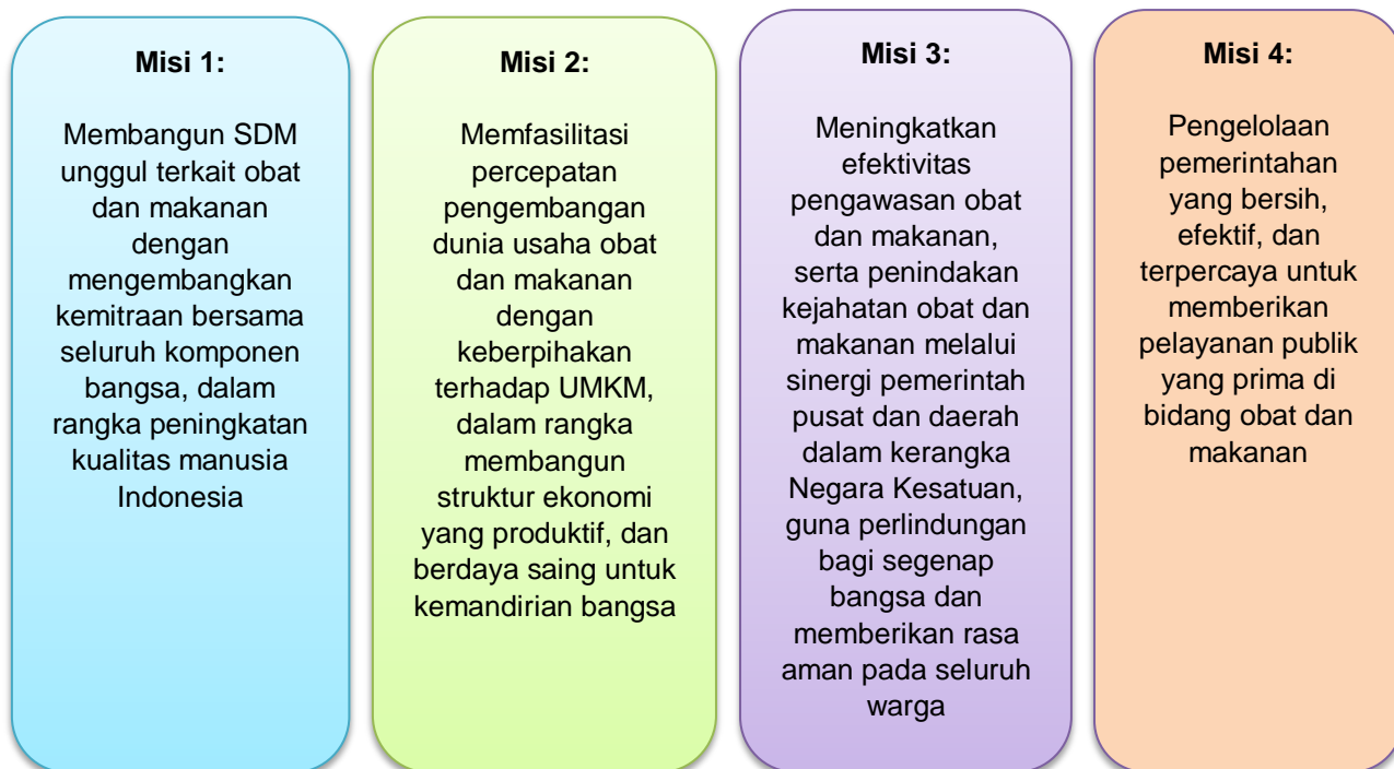
Gambar 2.2 Misi Loka POM di Kota Payakumbuh 2020-2024

Untuk mewujudkan visi tersebut di atas, telah ditetapkan misi Loka POM di Kota Payakumbuh sesuai dengan misi Badan POM sebagai berikut: